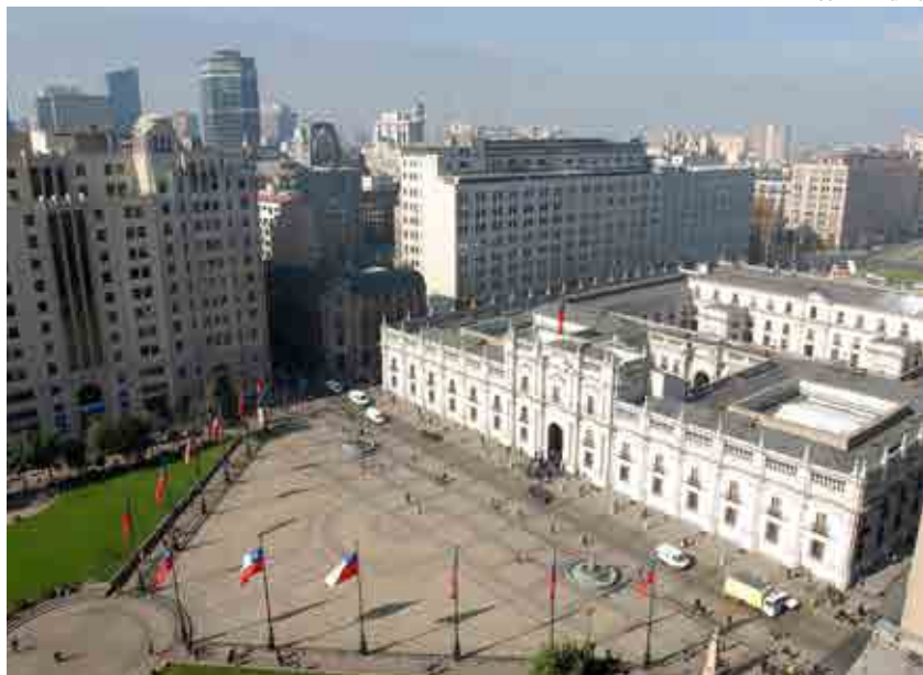
Palácio de La Moneda é a sede da Presidência da República do Chile