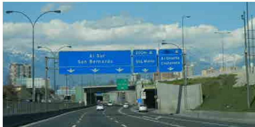
Vias em Santiago tem Cordilheira dos Andes como pano de fundo