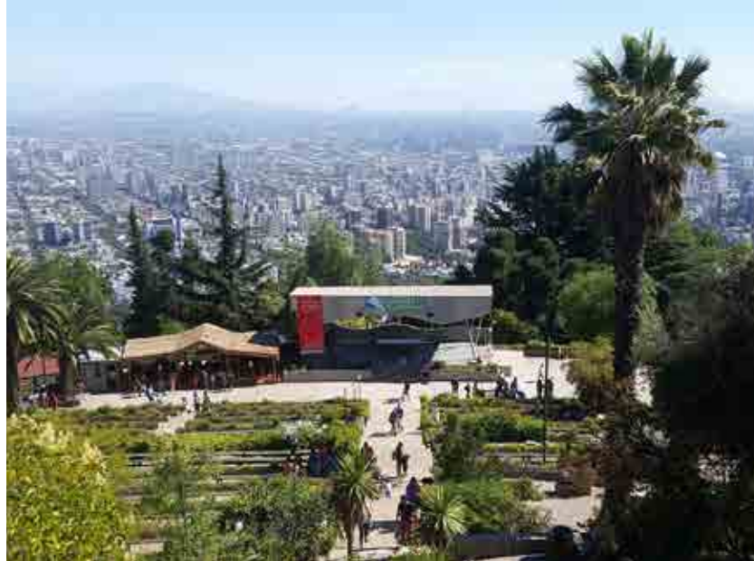
Vista panorâmica de Santiago no Cerro San Cristóbal